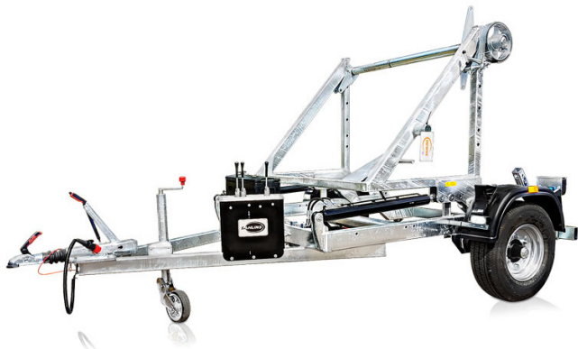
Trommelhenger 4720 (Powerpack)