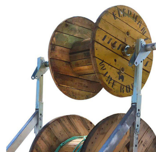
Forlengelse til ekstra trommel

Som standard er vognen utstyrt med forskriftsmessig belysning.