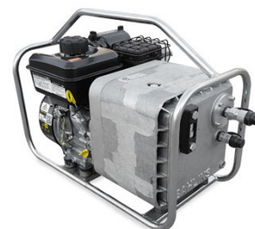
Hydraulisk aggregat 6HK 160 bar