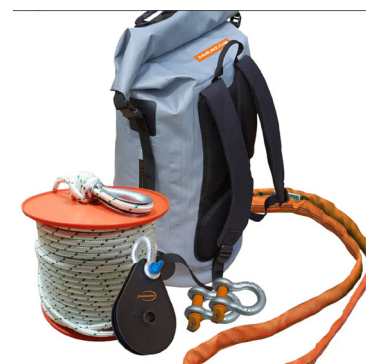
Tilbehør inkludert i Batteri vinsj 3022-B sett