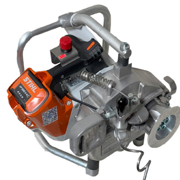
Batteri vinsj 3022-B