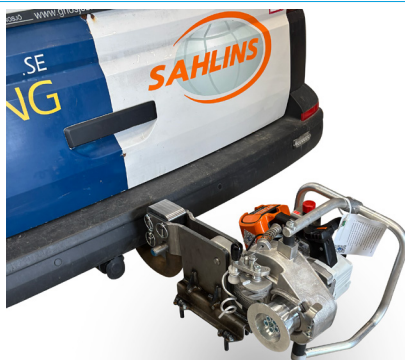
Tilhengerfeste- og kabelstige innfesting